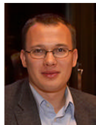
Rait Kapp IT tugi